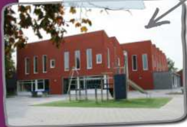
De Abkerwinde Haage Mierde